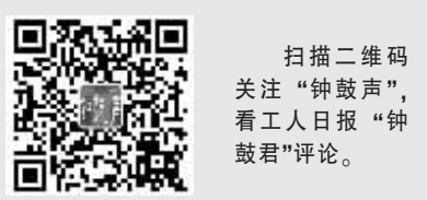
扫描二维码 关注“钟鼓声”， 看工人日报“钟鼓君”评论。

种程度上决定了网民获取信息、参与网络生活的质量和体验。为广大网民提供及时、准确、真实的新闻信息以及便利的服务，上述新闻网站无疑责任重大。 “网络空间天朗气清、生态良好，符合人民利益。网络空间乌烟瘴气、生态恶化，不符合人民利益。”希望相关网站、监管部门等各方共同努力，推动网络世界驱散乌烟瘴气，迎来风清气正。