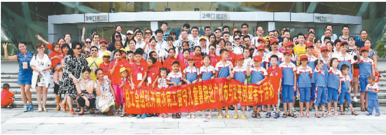
2016 年广西农民工留守儿童暑期赴粤亲子活动

的新媒体平台。目前，桂工网“职工在线”服务平台日均访问量已达 2 万人次，今年收到各类情况反映及建议 7404 条，公开发布信息 6682 条，回复职工特别是农民工关注的话题 7214 条。全区工会办公专网、全区工会视频会议培训服务系统已竣工。各级工会通过在当地政府网设立工会信息公开平台、开通工会网站、建立工会机关“云桌面”系统，以及微博、微信、QQ 群等各种方式，积极开展网上工作。