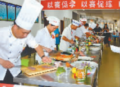
开展职工劳动竞赛