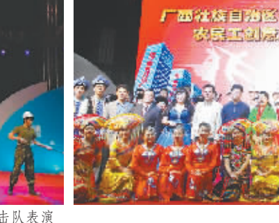
文艺汇演演职人员合照