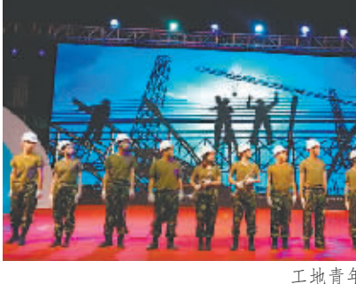
工地青年突击队表演