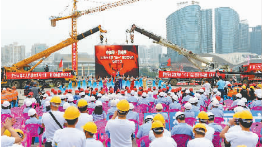
中国梦·劳动美 2016 年庆祝“五一”特别节目在南宁国际会展中心改扩建工程项目工地举行

建立京津冀地区广西务工创业人员服务站，搭建了以区内为主、兼顾区外的农民工综合服务平台；三是以工会创业就业技能培训基地、农民工夜校、职工大学为依托，搭建了培训、就业、创业“一条龙”服务的农民工培训平台；四是建立覆盖全区 14 个市和 112 个县区工会的法律服务律师团（站），并向工业园区、乡镇（街道）、大型企业等农民工集中的区域延伸，搭建了便捷高效的农民工维权服务平台；五是开通了“广西工会”“桂籍农民工娘家人”微信服务公众号，设立了“职工在线”“红娘联盟”“桂工学院”三大网络服务平台，搭建了网上网下互联互通、互动交流