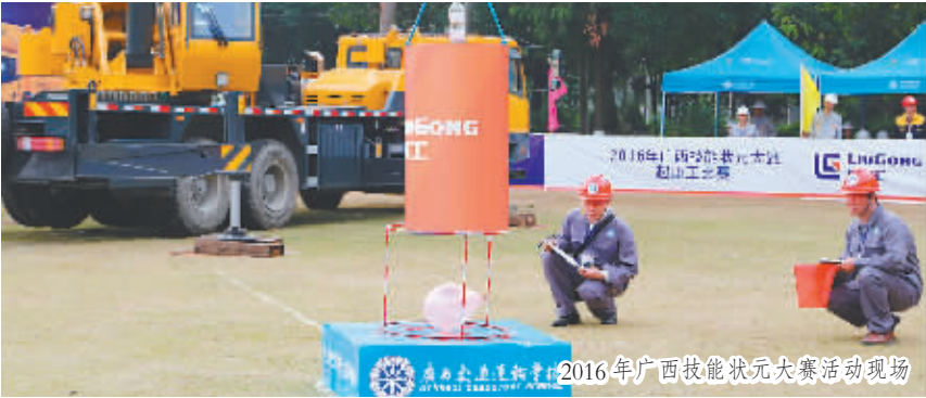
2016年广西技能状元大赛活动现场

今年以来，广西各级工会认真贯彻落实中央和自治区党委一系列决策部署，紧紧围绕增强“政治性、先进性、群众性”和去除“机关化、行政化、贵族化、娱乐化”的要求，着力固基础、强服务、促创新、谋发展，各项工作取得了积极进展。