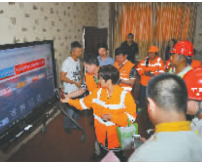
农民工体验“网上工会”

今年以来，广西各级工会认真贯彻落实中央和自治区党委一系列决策部署，紧紧围绕增强“政治性、先进性、群众性”和去除“机关化、行政化、贵族化、娱乐化”的要求，着力固基础、强服务、促创新、谋发展，各项工作取得了积极进展。