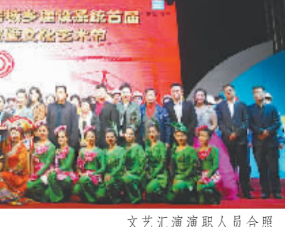
文艺汇演演职人员合照