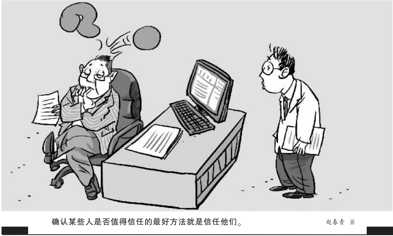
确认某些人是否值得信任的最好方法就是信任他们。

装。可是,他们就是划不过来这个劲儿,非要正着放镐头,镐头顿下去,正好反着。我看着我着急,就过去装,用力下顿镐头,镐头着地打了滑,镐把儿一下子就打在我的下巴上。打开一条口子,鲜血直流,工友马上找来纱布给我包上。其实什么事儿没有,队长说啥让我回驻地休息。那个时候,还没有成家,回后线也没有地方去,只好就待在井队。三五天以后,闲着没事儿,找队长跟班上井。队长问我感觉怎么样,又亲自看了一下伤口,对我说,别回班上啦,正好炊事班缺人,去炊事班。