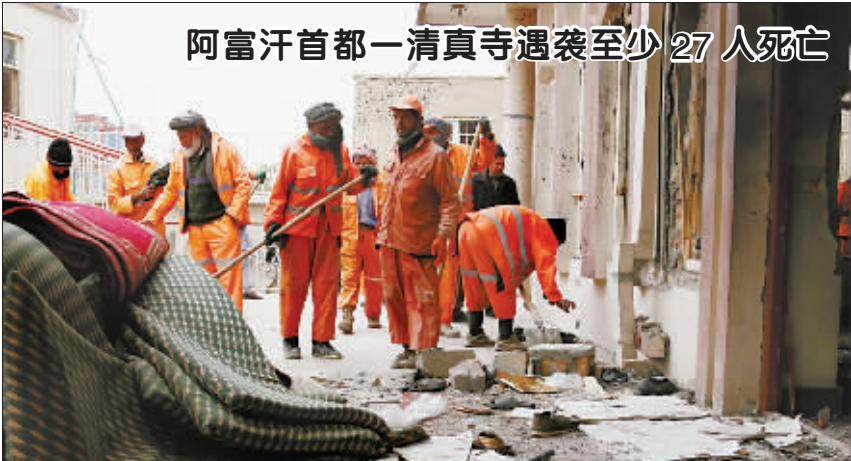
阿富汗首都一清真寺遇袭至少27人死亡

11月20日,法国中右翼阵营举行2017年总统选举初选首轮投票,结果被视为“黑马”的62岁前总理菲永 and 71岁的前总理莱佩排名前两位,进入下一轮投票,选前被看好的前总统萨科齐则排名第三,意外出局。在分析人士看来,菲永胜出的原因是他的竞选纲领明确,很多法国人将他视为能够带领法国走出困境的人。凭借这一点,菲永或许能够一“黑”到底。