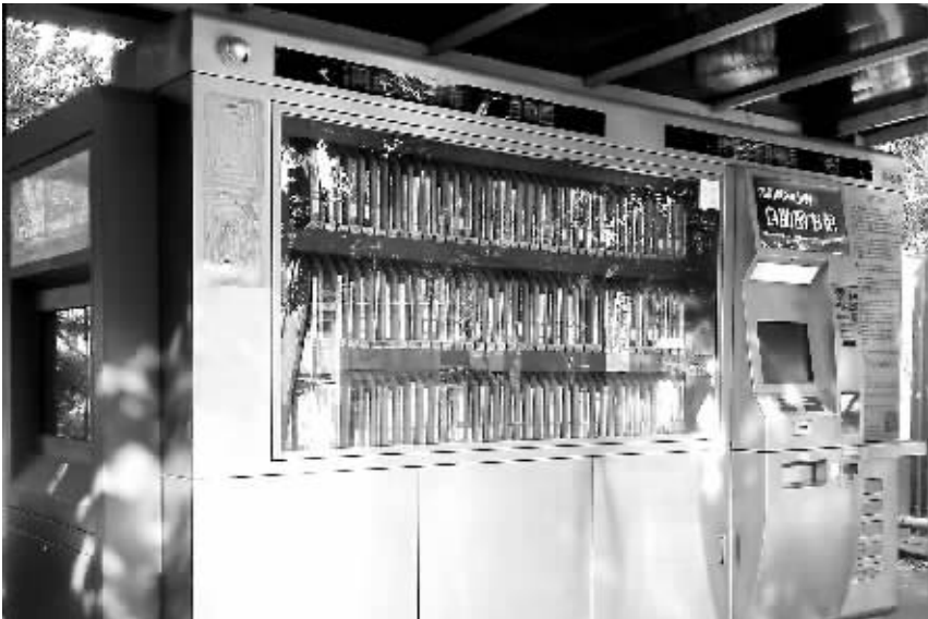
北京朝阳区 设立在住宅小区的自助图书馆,橱窗内几乎全是通俗文化读物,借阅情况并不理想,如果能联网图书馆预约,借阅的主动性得到体现,实效会不会更好呢?

为了提升班组专业管理水平,北郊运维班依托工会、信通的大力支持,建立了可视化变电站基础资料查询系统。该套系统以变电站平面布置图为基础,将整个变电站信息进行集成,通过鼠标点击相应设备区域,即可显示相应的设备参数、设备照片、环境照片等信息,所有图片均为专业公司拍摄,从而保证了