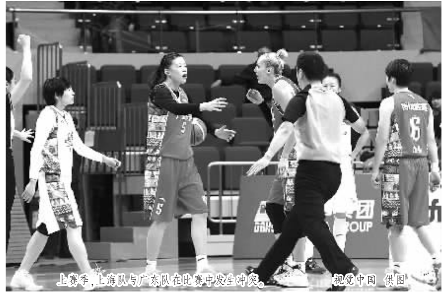
上赛季，上海队与广东队在比赛中发生冲突。

公室相关负责人在接受记者采访时表示：“新赛季是WCBA的第16个赛季，累计增加处罚的规定也是针对上赛季出现的一些情况而采取的措施，目的就是为了完善制度，让联赛适应职业化的发展。” 争议判罚是WCBA面临的又一个问题。2014~2015赛季，黑龙江女篮与八一队的比