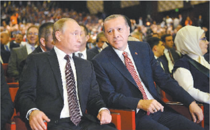
10日,俄罗斯总统普京(左)和土耳其总统埃尔多安(右)出席世界能源会议。