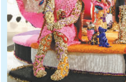
10月11日,德国德累斯顿,在纽约发展的波兰编织艺术家奥勒克推出了自己的最新作品,一座用毛线编织的旋转木马。奥勒克之前编织过雕塑、人,甚至是整栋房屋,她的作品曾在英、美、德、法和巴西、哥斯达黎加等国巡回展出。