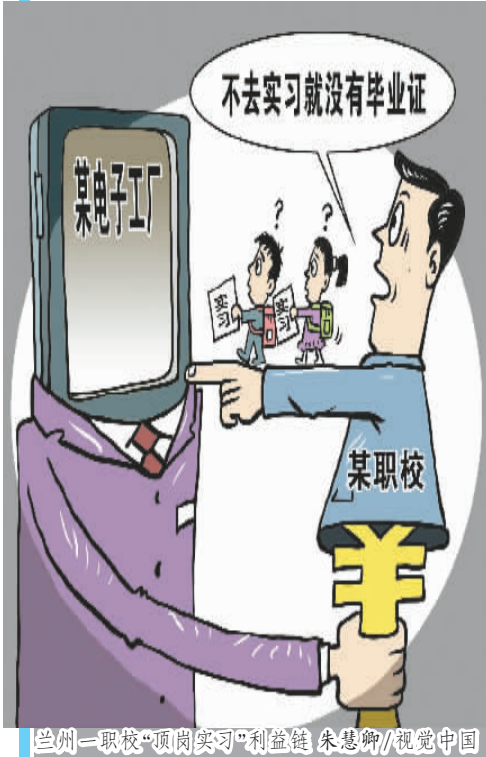
兰州一职校“顶岗实习”利益链,朱慧卿/视觉中国

有专家称,把学生作为廉价劳动力“卖”给工厂的顶岗实习,对我国职业教育的健康发展和企业的升级换代,都产生恶劣的影响,必须出重拳加以治理。