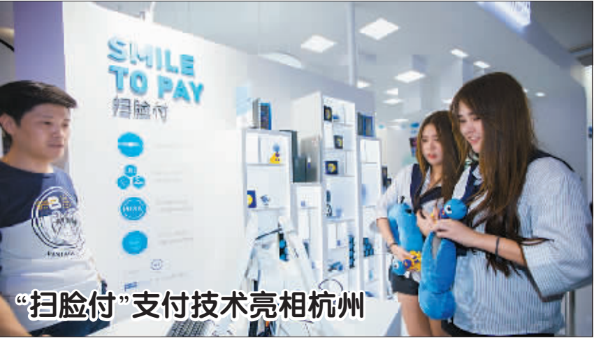
10月12日,一对双胞胎女孩在杭州云栖大会会场一展台内体验“扫脸付”生物识别支付技术。 据了解,“扫脸付”利用人脸识别等技术,用“刷脸”取代传统密码,力求打造更加安全、便捷的支付方式。2016杭州云栖大会由杭州市政府与阿里巴巴集团主办。

企业、投资人签订的各类合同协议,基于公共利益确需改变承诺和约定的,严格按照法律程序进行。 方案明确,进一步开放民用机场、基础电信运营、油气勘探开发、配售电、国防科技等领域,市场准入对各类投资主体要一视同仁;加快修订政府核准的投资项目目录;依法依规加快民营银行审批;按照统一标准对民营企业进行信用评级;尽快出台《企业投资项目核准和备案管理条例》,进一步落实企业投资自主权,规范政府对企业投资项目的核准、备案等行为。