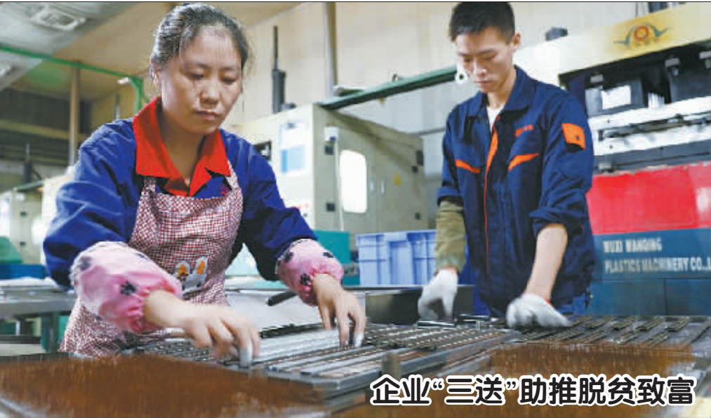
企业“三送”助推脱贫致富

时,如缺乏发票等凭证,三星公司有义务对应自身销售记录,后台激活记录查询确定,履行召回义务,不得以此为由拒绝退货;消费者选择换机的,三星公司对其他型号手机的计价应合理,且应在更换时提供全新的三包凭证,对购买凭证(发票等)做出明确有效的更正;在消费者退机或换机过程中,三星公司应为消费者提供数据存储转换服务,并做好保密工作;消费者因配合本次召回所产生的产品邮递费用由三星(中国)投资有限公司承担;三星公司应向发生爆炸问题的消费者致歉,并依法赔偿消费者损失。