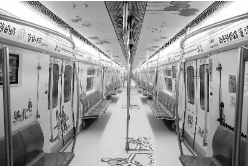
“书香专列”空驶车厢