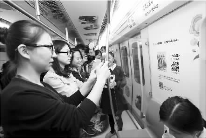
乘客争相扫码下载图书

但也应看到,近年来数字阅读正在成为全民阅读新亮点,移动阅读的需求量不断增加。调查报告显示,数字阅读中,成年国民手机阅读率最高,达到 60.0%,同比上升高达 8.2 个百分点。2015 年,从新兴媒介来看,人均每天手机阅读接触时间最长。我国成年国民人均每天手机阅读时长为 62.21 分钟,同比增了 28.39 分钟。