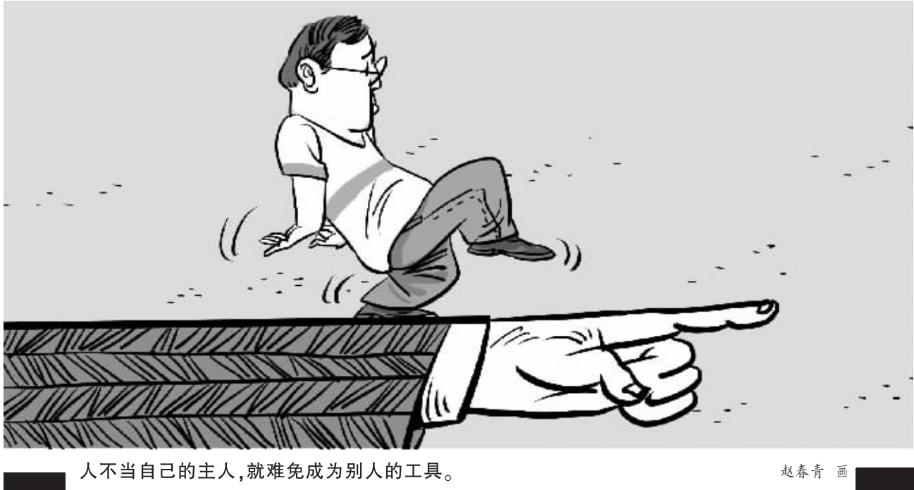
人不当自己的主人,就难免成为别人的工具。

多少年过去,重阳归乡的事情再未有过,但那炊烟温暖的画面却长久留在我的记忆里。那些炊烟,承载了我对于乡关的鲜明触动,它们一遍一遍地提醒着我:家园如此美好,问君何忍远离?