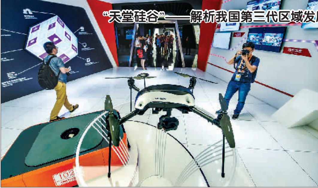
“天堂硅谷”——解析我国第三代区域发展样本之路

河北省张家口市中级人民法院二〇一六年四月二十五日以(2016)冀07民算1号民事裁定书裁定受理察哈尔国际汽车文化基地有限公司强制清算一案,并于二〇一六年六月二十九日指定张家口市信德破产清算有限公司为察哈尔国际汽车文化基地有限公司清算组。为了保护债权人的合法权益,根据《中华人民共和国公司法》和公司章程及有关法律法规规定,察哈尔国际汽车文化基地有限公司有关债权人应直接