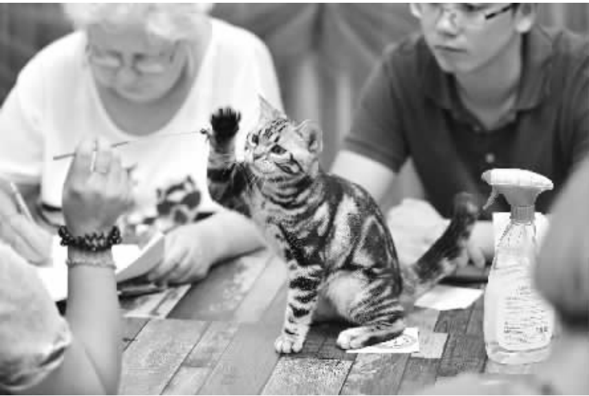
8月21日,辽宁省沈阳市,2016中俄WCF国际宠物猫大赛人气旺,各种名猫亮相,吸引了众多市民前来与“喵星人”近距离观赏。

而随着城市动物管理规范的愈加严格,室内饲养的宠物猫开始成为很多家庭的新宠,由此也催生出一条以饲养、贩卖名贵宠物猫的产业链,在这一链条中,猫舍成为核心一环。记者采访发现,在沈阳,有的猫舍经营者甚至能够年赚百万。与此同时,由于大多数猫舍藏身居民楼中,缺乏相关的卫生设施,由此引发扰民、宠物未经检疫影响健康等一系列问题。