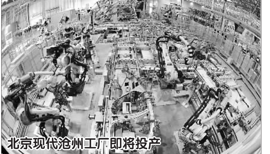
北京现代沧州工厂焊接班间生产线(9月8日摄)。作为落实京津冀协同发展的实质性举措，北京现代沧州工厂于2015年4月份开工建设，目前厂区建设已基本完工，正在进行生产设备的联动调试，预计10月份可量产。新华社记者 牟宇 摄

记者查阅了西安市教育局近年的工作要点，从中可以窥见西安市学校建设的部分状况，2014年该局提出“全力推进开发区36所新建学校项目及区内中小学、幼儿园提升改造项目的实施”，2015年又称“全力推进开发区36所新建学校项目，确保秋季开学时建成投入使用”，2016年继续强调“完成开发区36所新建学校和150所行政区内学校提升改造项目”。显然，教育部门也在忙活，但教育资源的配套还是跟不上城市规模的扩张。数万随迁子女的“上学难”，究竟该如何解决呢？