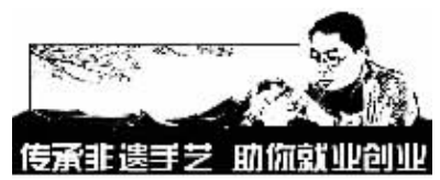
传承非遗手艺 助你就业创业

据麦可思研究院数据显示,辞职并非个别现象。2012届大学毕业生3年内平均为2.2个雇主工作过,58%的本科毕业生和77%的高职高专毕业生3年内至少跳槽1次。值得一提的是,在2012届大学毕业生中,毕业3年内一直为1个雇主工作的毕业生月收入最高,其中本科生平均为6487元,高职高专生平均为5293元。