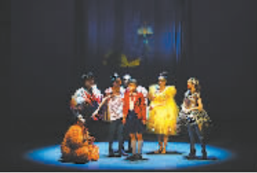
中国儿艺原创儿童剧《时间森林》

据悉，中国儿童戏剧节迄今为止，已连续举办6年，六届戏剧节共有18个国家和港台地区150家院团253台剧目演出1237场，平均上座率达95%以上，惠及观众90万人次，取得了良好的社会效益和经济效益，已成为中国乃至世界儿童戏剧的知名品牌。