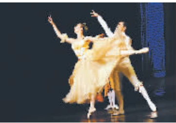
罗马尼亚儿童剧《足尖上的辛德瑞拉》

本报讯（记者周倩）8月25日晚，由中国儿童艺术剧院主办的第六届中国儿童戏剧节在北京怀柔剧场举行闭幕式。文化部艺术司副司长吕育忠及来自国内外儿童剧院（团）的代表和观众朋友们共同回顾了本届戏剧节的美好时光，并观看了中国儿艺新创排的首部用魔幻演绎现实的原创儿童剧《时间森林》。