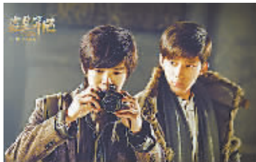
电影《盗墓笔记》剧照

据新华社 无论是从小说《盗墓笔记》到由其改编的同名网络季播剧、电影，还是从小说《鬼吹灯》到由它改编的电影《九层妖塔》、《寻龙诀》，对于“超级IP”改编，如何平衡普通受众和原著粉丝的“双派”支持，成了导演和编剧的“心头石”。