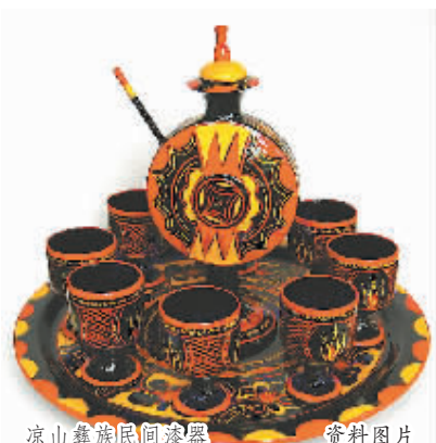
凉山彝族民间漆器

“如何解决非遗在现代化进程中所面临的问题，是当下非遗保护与传承工作的难点所在。”相关非遗保护专家对记者谈到，很多非遗已经成为过去生活方式的一种记忆，要让这种传统记忆在现代生活中活起来，就必须寻找非遗的传统性与当代时尚性、现代性的结合点。而目前凉山州所探索的“非遗+”模式不失为可以借鉴的破题之路。