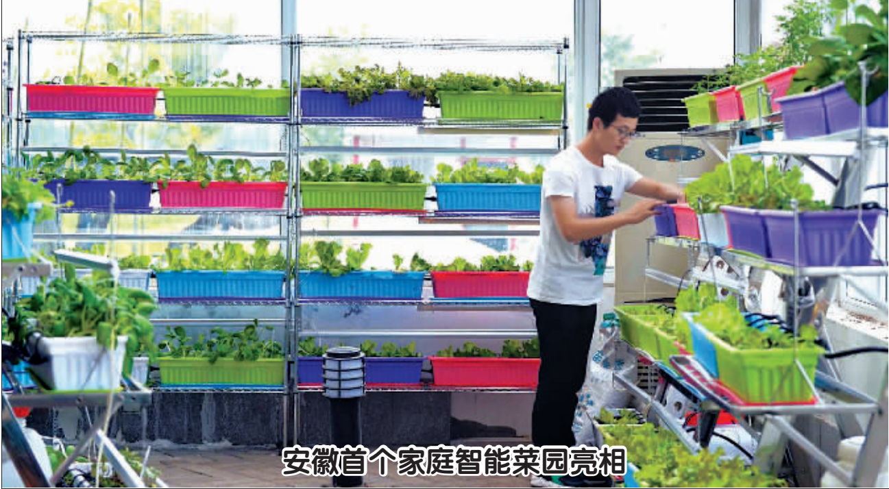
8月22日,在安徽省合肥市庐阳区三十岗乡东华农科,工作人员在智能菜园里察看蔬菜长势。近日,合肥市庐阳区三十岗乡东华农科成功研发出安徽省首个家庭智能菜园。 阳台、客厅、卧室、或办公室,一年四季皆可种植。

报告;不准利用行政权力、行政职能和垄断地位,以服务为名,以签订自愿服务协议等形式搭车收费、变相收费;不准通过设置不合理的市场监管和准入条件,拒绝引入有资质的专业服务机构,垄断经营、指定服务、强制收费;不准在法检过程中的同一环节、同一项目,存在2个以上单位重复取样、检验报告一单多用、重复收费等情况;不准超越经营服务范围收费,不准只收费不服务或少服务等;不准对收费目录清单和收费公示之外的项目收费;不准对未明码标价的项目收费;不准有利用标价进行价格欺诈等不正当的价格行为。 同时,通知要求质检部门所属协会、学会等社会团体不准强制或变相强制企业入会并收取会费;不准展览或变相强制企业参加各类会议、培训、展览、考核评比、表彰、出国考察、赞助、捐赠、订购刊物等活动并收费。