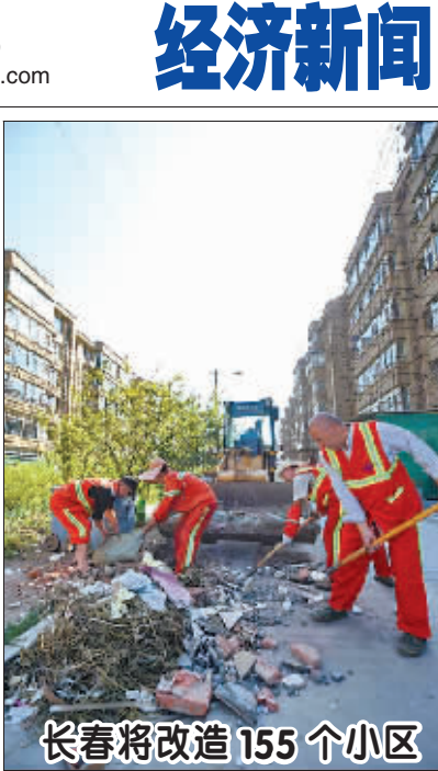
8月22日,环卫工人在长春市东岭南街旁一个老旧小区内清理垃圾。 2016年长春旧城改造工程已经进入全面施工阶段,长春市城管委、市规划局、市园林绿化局、市政设施维护管理中心等多职能部门协作,将有155个老旧小区得到升级改造。

此外,前端回收的不规范也让企业十分头疼。杨继承告诉记者,目前企业绝大部分的废旧产品来自省内外的个体户,但这样的模式很难保证回收物的质量。为此,今年初,公司曾在长沙试行设立直营回收点,但由于成本过高,仅运行1个月就关闭了。 显然,进一步做好顶层设计,落实现有政策法规和利用“互联网+”整合有限的资源,构造再生资源回收、分拣、转运、加工利用、集中处理为一体的产业化格局,已经是关系到这个行业能否“再生”和可持续发展的现实课题。