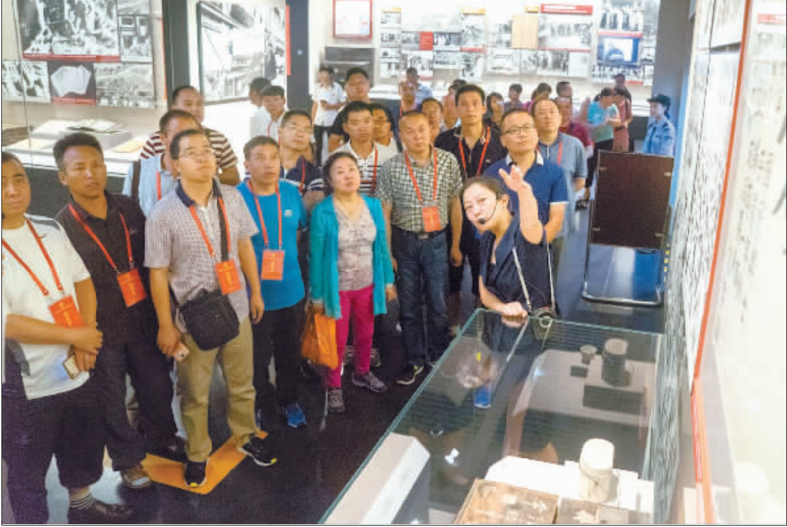
8月17日上午,参加休养的青年技工劳模来到中国人民抗日战争纪念馆参观。 图为讲解员正在为他们讲解展览文物背后的抗日故事。