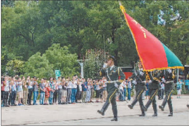
8月19日上午,参加休养的青年技工劳模走进军营。