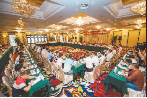
8月15日上午,弘扬工匠精神座谈交流会在全总国际交流中心展开。青年技工劳模畅所欲言,分别表达他们对于劳模精神、劳动精神、工匠精神的理解。