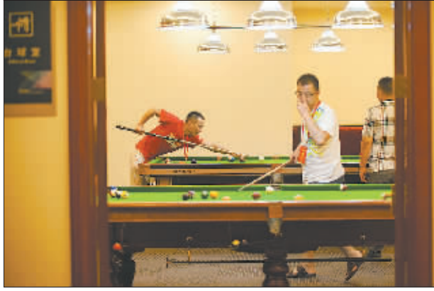
8月16日晚上,几位青年技工劳模在全总国际交流中心台球馆切磋球技。