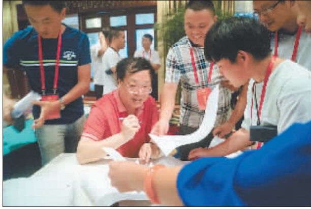
8月18日下午,全国劳模包起帆走进劳模休养大讲堂与大家分享创新发明心得。 图为讲座结束后,部分青年技工劳模请包起帆为他们签名。