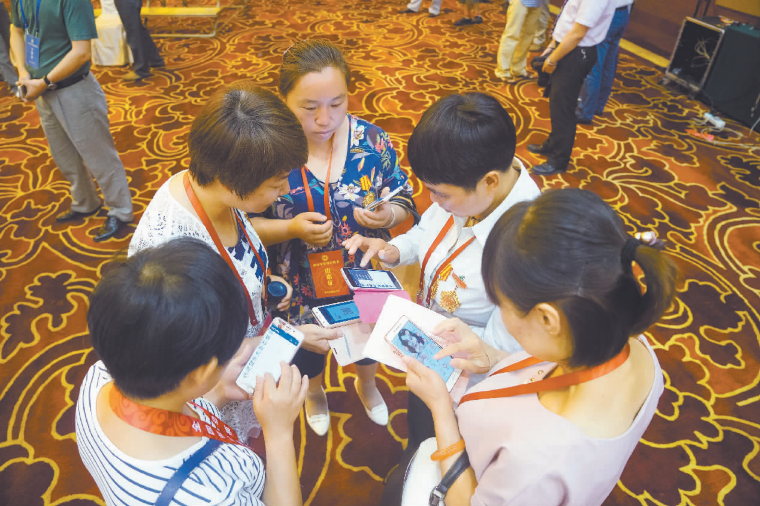
8月15日上午,首批参加休养的100名青年技工劳模齐聚全总国际交流中心综合楼合影留念。 图为合影前,5位刚刚认识的女劳模在互加微信。

8月14日,来自全国各地的100名青年技工劳模来到中华全国总工会国际交流中心,开始为期一周的休养。这也标志着2016年全国劳模休养正式启动。在接下来4个月的时间里,全国5000名劳模将分44批前往全国14个劳模休养基地休养。 参加此次劳模休养的100名青年技工劳模,全部为一线技术工人,其中最小的只有25岁。他们凭着出众的技术能力,获得过全国劳模、全国五一劳动奖章、“最美职工”等荣誉称号。