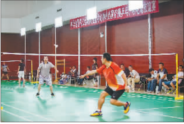
8月16日晚上,一场别开生面的全国青年技工劳模乒乓球、羽毛球友谊赛在全总国际交流中心乒羽馆展开。