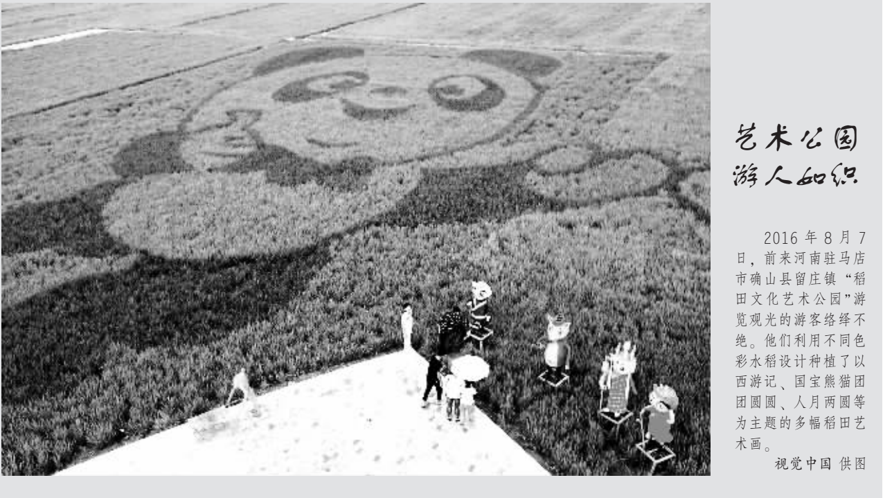
艺术公园 游人如织

国家旅游局日前发布的2016年上半年旅游统计数据报告显示,2016年上半年,我国旅游市场规模稳步扩大。其中,国内旅游22.36亿人次,比上年同期增长10.47%;出境旅游1.27亿人次,增长4.1%;上半年实现旅游总收入2.25万亿元,增长12.4%。中国公民出境旅游人数5903万人次,比上年同期增长4.3%。 一方面是人们旺盛的旅游需求,另一方面,却是随之增多的旅游安全事故。 近日,华侨大学旅游学院、中国旅游研究院等多家机构联合发布《中国旅游安全报告(2016)》。报告显示,旅游交通行业安全方面,与2014年相比,2015年我国旅游客车、客轮和大巴发生重大交通事故的起数和死亡人数均有所上升;旅游安全事件形势方面,2015年,我国自然灾害引起的旅游安全事故发生频次及造成的游客死伤人数均有所增