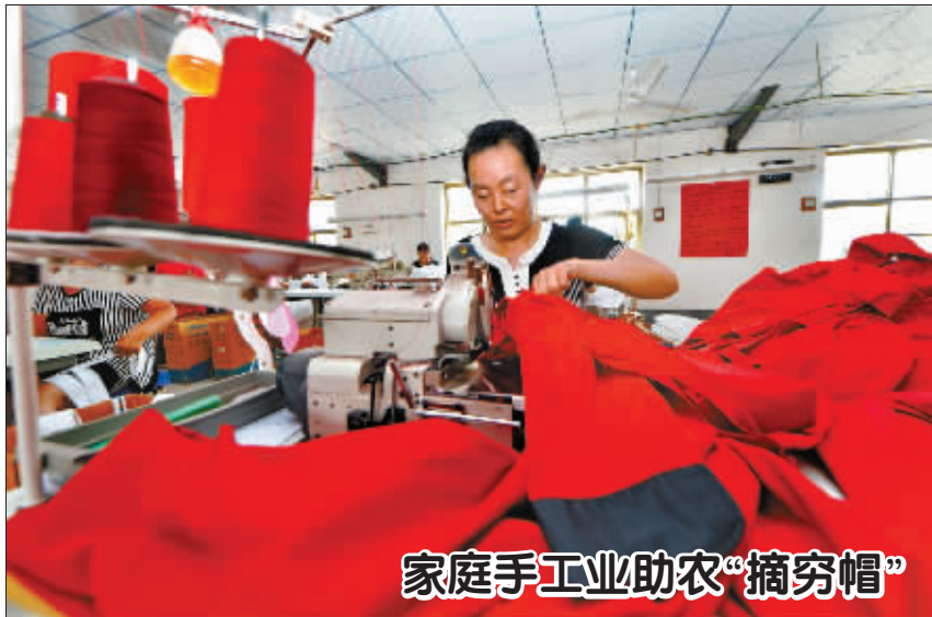
家庭手工业助农“摘穷帽”

但机械工业行业投资增速在下降,市场需求仍不稳定。数据显示,上半年机械工业投资仅增长3.07%,创2008年以来同期增速新低;上半年企业累计订货额增长4.81%,订货形势仍不稳定。