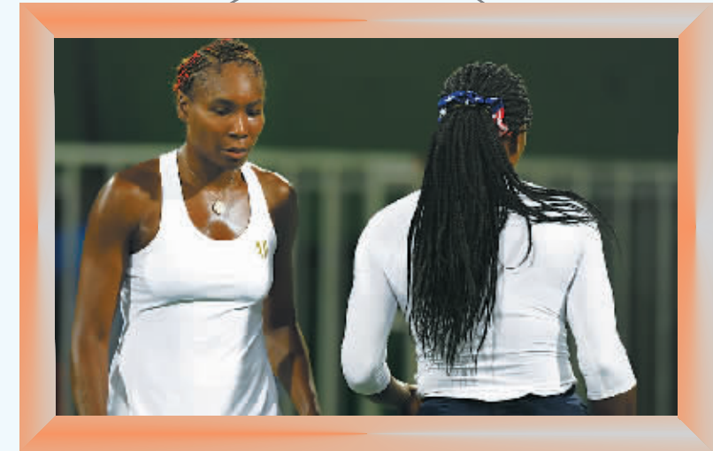
▲北京时间8月8日,美国组合威廉姆斯姐妹在里约奥运会网球女双首轮0比2不敌捷克组合萨法洛娃/斯特里科娃。