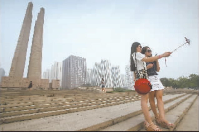
左图:唐山地震博物馆里展出的当年地震发生后不久航拍到的影像资料。