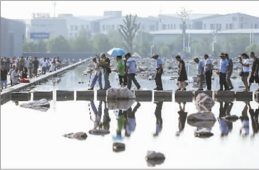
7月28日,前来祭奠的人流依次走过广场里的纪念水池。