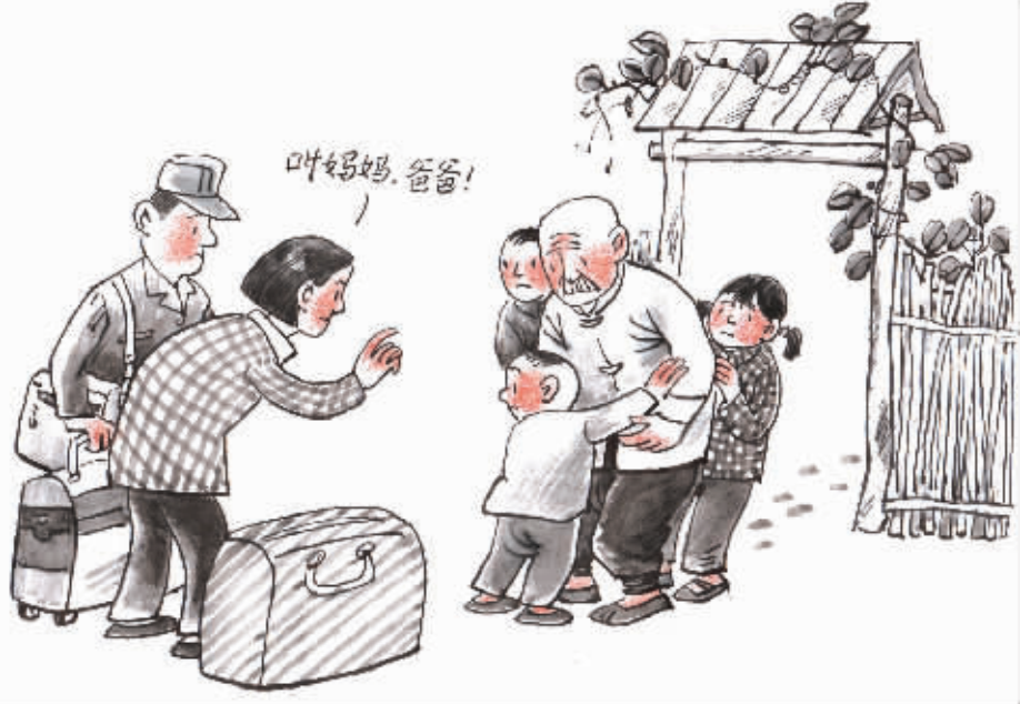
打工久不回 儿女相见不相识