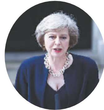
英国首相特雷莎·梅

对于 59 岁的特雷莎·梅来说,上任之后最重要也是最棘手的问题,自然是迫使前首相卡梅伦下台的原因——“脱欧”。由于此前的“留欧”立场,特雷莎·梅颇受“脱欧”派的质疑,但在新组建的内阁中,特雷莎·梅有意平衡了“脱欧”和“留欧”两派,“脱欧派”的灵魂人物伦敦前市长鲍里斯·约翰逊被任命为外交大臣,财政大臣由支持“留欧”的前外交大臣哈蒙德担任,前能源与气候变化大臣安布尔·拉德出任内政大臣。另外,特雷莎·梅还任命保守党国会议员戴维·戴维斯担任新创设的“脱欧”事务大臣一职,专门负责英国脱离