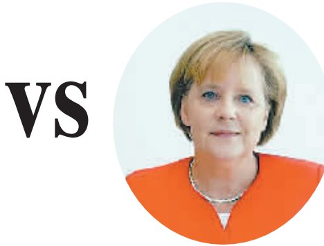
德国总理安格尔·默克尔(资料图)