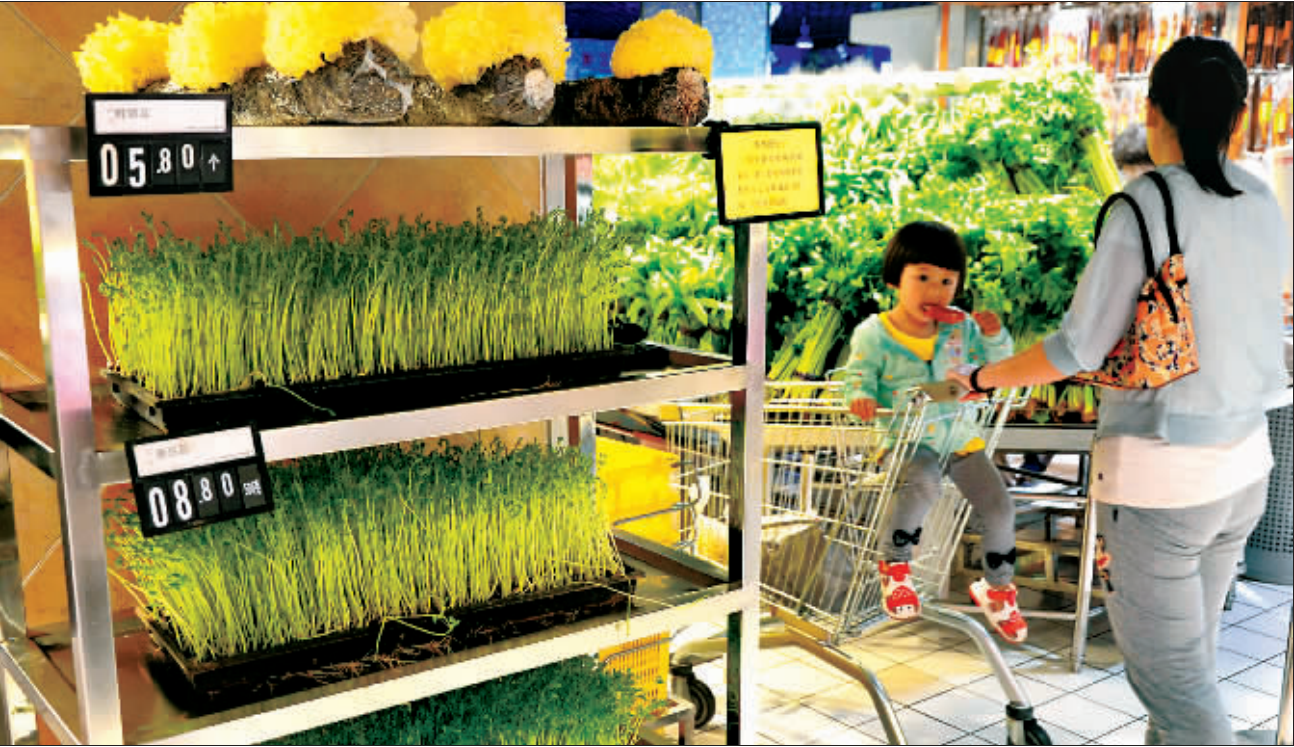
许昌“活体蔬菜”进超市 5月30日,河南许昌市区某超市,“活体蔬菜”豌豆苗、银耳亮相,吸引人们的眼球。随着人们对健康的要求越来越高,一些商家开始大打“健康牌”,推广售卖新鲜的“活体蔬菜”,成为超市的一道风景。

本报讯 (记者孙震海 通讯员王洪玮)日前,山东省济宁市兖州区专门召开化工产业转型升级工作任务分工会议,宣布对区域内的47家化工生产企业中的12家注销、停产和依法关闭,对3家进行规范,其余32家进入“三评级一评价”程序完善提升。 兖州是老工业基地,橡胶轮胎、工业用纸、精细化工、农机装备、煤炭、医药六大传统产业支撑着区域经济大半江山。“这样的大块头、老大家,遇到全球经济低迷,旧的发展动能乏力,逼着我们激发新动能,用供给侧的思维、用科技手段升级改造传统产业势在必行,在产业结构调整中完成新旧发展动能的接续转换。”兖州区区委书记张玉华给出了传统产业改造升级的新思路。 针对传统产业,兖州区主动作为,加大供