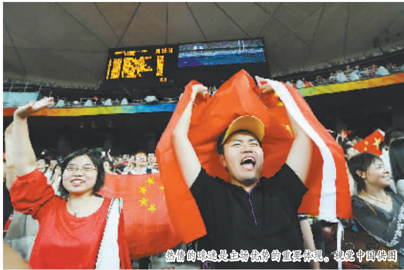
热情的球迷是主场优势的重要体现。

主场优势的确存在,但它究竟因何而来却存有争议。传统观点认为,天时地利人和,是构成主场优势的主要原因。主队熟悉环境,不必舟车劳顿,球迷支持,更适应气候和饮食,甚至裁判“照顾”等,都被视为主