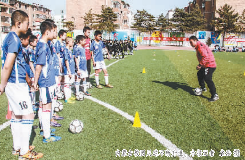
内蒙古校园足球不断升温。

“经过一年多的努力,我们实现了从 0 到 1 的突破,内蒙古也算有了足球这回事,但要实现 1+n,我们还有很多工作需要做。”这是内蒙古自治区体育局副局长吴刚主管