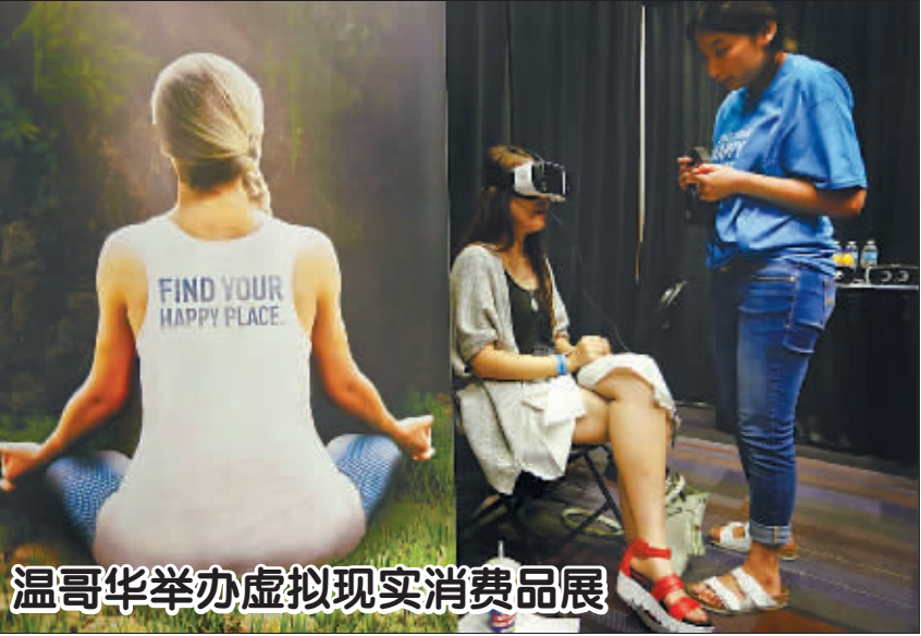
5月14日,在加拿大温哥华,参观者在虚拟现实消费品展上体验一款据称能令人放松心情的产品。温哥华当天举办虚拟现实消费品展,约40家虚拟现实科技公司在会场内展示各自的产品。

印度媒体称,远景规划比较适合印度情况,如果执行好可以成为一个决策平台,很好地配合印度年度预算。