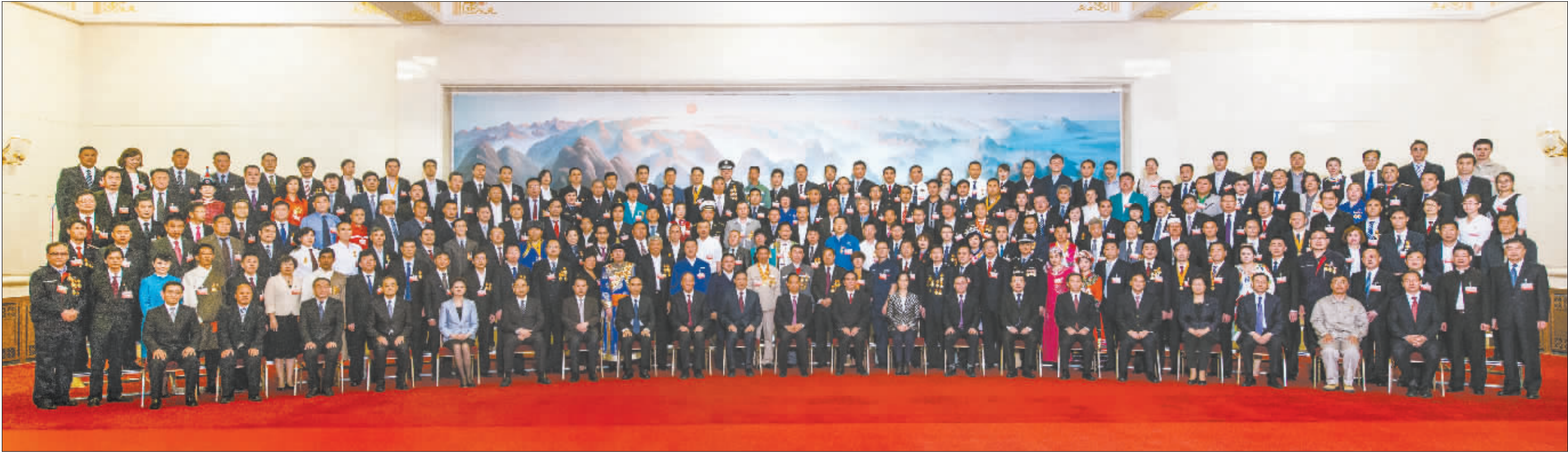
4月29日,庆祝“五一”国际劳动节暨全国五一劳动奖表彰大会开始前,受表彰的先进集体和个人代表在人民大会堂合影。