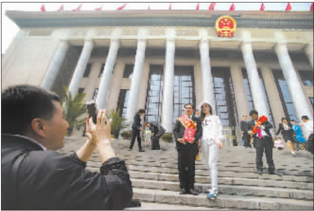
4月29日,表彰会后,一对来自浙江的父女看到劳动模范很是羡慕,邀请他们一起合影并互留电话。