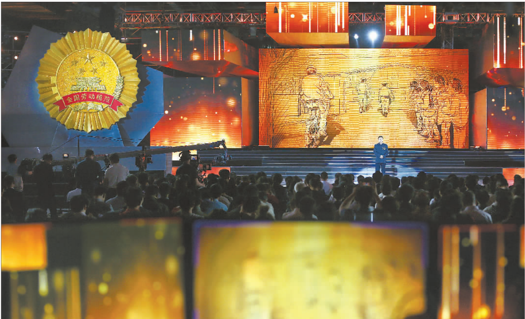
4月26日,在“中国梦·劳动美”2016年庆祝“五一”国际劳动节特别节目中,一幕情景朗诵《平凡的神圣》把观众带回那火红的年代。