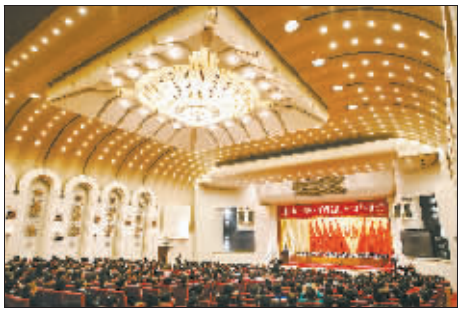
4月29日上午,庆祝“五一”国际劳动节暨全国五一劳动奖表彰大会在人民大会堂举行。