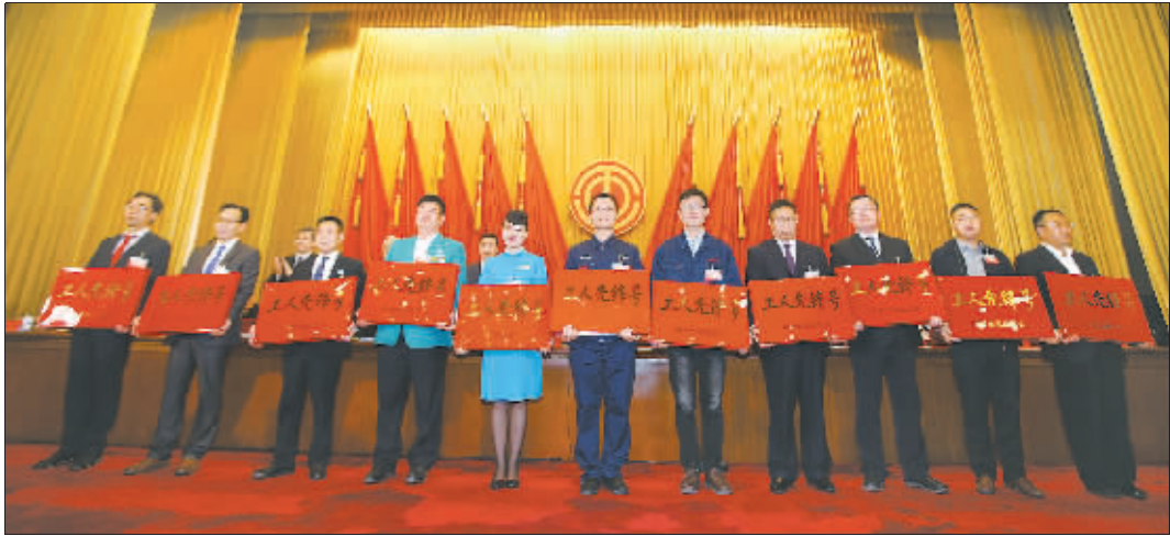
4月29日上午,全国工人先锋号获奖集体代表上台领奖后合影。