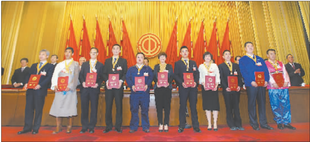
4月29日上午,全国五一劳动奖章获得者代表上台领奖后合影。