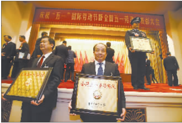
4月29日,表彰会后,获奖代表纷纷上台合影留念,定格这一难忘时刻。