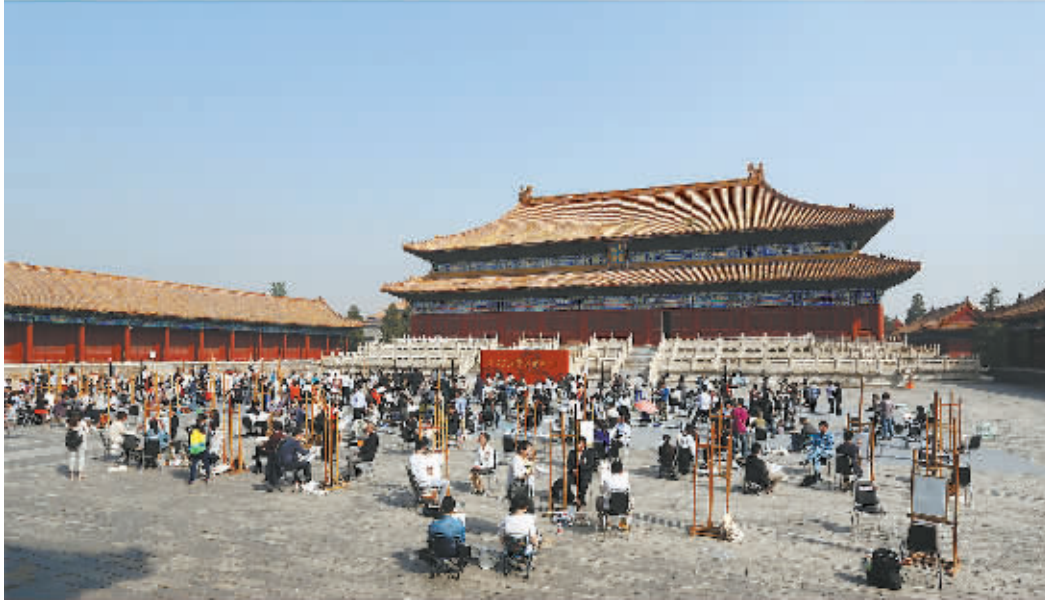
←担负“为民族设计”的历史使命。纪念中国人民抗日战争暨世界反法西斯战争胜利70周年阅兵式上,8架歼-10战机身披由中央美术学院设计团队为其量身订制的宝蓝色崭新战袍飞过天安门。