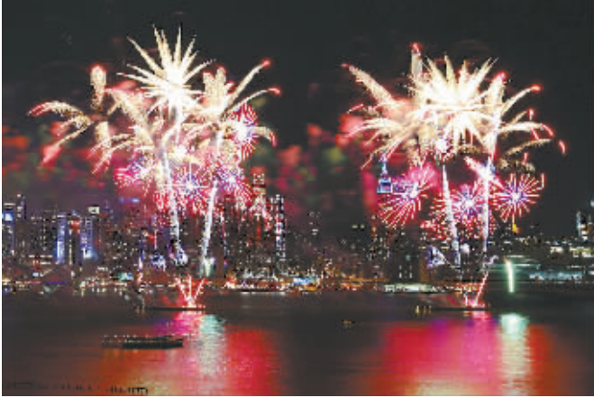
↑用艺术诠释中国,搭建国际对话桥梁。由中央美术学院承办的“欢乐春节·艺术中国汇”作为以当代公共艺术的形式宣传推广中国传统文化的大型国际艺术活动,在美国纽约亮相,获得海内外各界热烈反响,被文化部列为“欢乐春节”重点品牌项目。