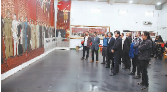
↑坚持以人民为中心,创造无愧于时代的艺术精品。2015年11月,历时3年创作而成的大型主题作品《新中国诞生》正式亮相并永久陈列在中国国家博物馆中央大厅,作品再现了中央人民政府委员会63位委员在开国大典上的风采,成为诠释新中国革命历史的重要作品。

学校大力推动思想政治教育与专业教育深度融合,通过采风、写生、社会实践、艺术考察、扶贫助教,引导学生从生产劳动现场、人文自然和现实生活中汲取营养,形成关注现实、服务社会和人民的创作观念,让高雅艺术走进大众和民间。 下乡写生和艺术考察是中央美术学院人才培养的重要环节,学校每年组织近千学生深入全国各地开展艺术创作和考察研究,描绘祖国山河和人民形象,把艺术劳动和生产劳动紧密结合在一起。 学校积极开展艺术实践与社会实践相结合的系列活动,如暑期社会实践、红色1+1