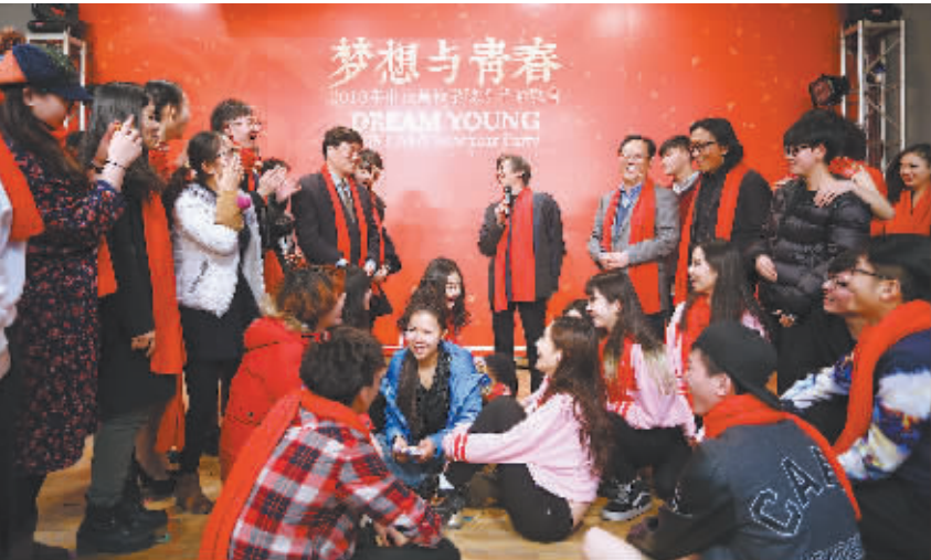
↑引领中国美术和美术教育事业,成就艺术梦,实现百年梦,共铸中国梦。2015年中央美术学院新年联欢会,学校领导班子与师生们共话梦想与青春。

一流人才的优势;建立和完善学科发展和调整机制,构建完备的现代高等美术教育学科体系;深化招生考试和教学改革,完善具有中央美术学院特色的高端艺术人才的培养方式;建立和创新推动师生创作和学术研究的机制,为精品创作和重大美术理论研究营造浓厚学术氛围;建立协同创新机制,服务国家现代化建设的重大需要;践行社会主义核心价值观,创新学生工作模式。学校通过深化综合改革,为更好地服务国家和社会打下了良好基础。