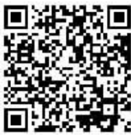
(图表说明:数据来自工人日报头条号) (二维码说明:扫描二维码欢迎参与讨论)