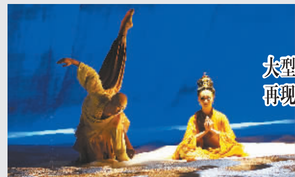
大型舞剧《丝绸之路》再现千年文化交融史

大型歌舞剧《丝绸之路》是一个由一系列隐喻构成的象征舞剧,有别于以往惯性思维或者既定经验中的舞剧样式,更富有现代艺术流派的某些特征。据悉,该剧将于4月22日至23日在北京天桥艺术中心拉开展演大幕。