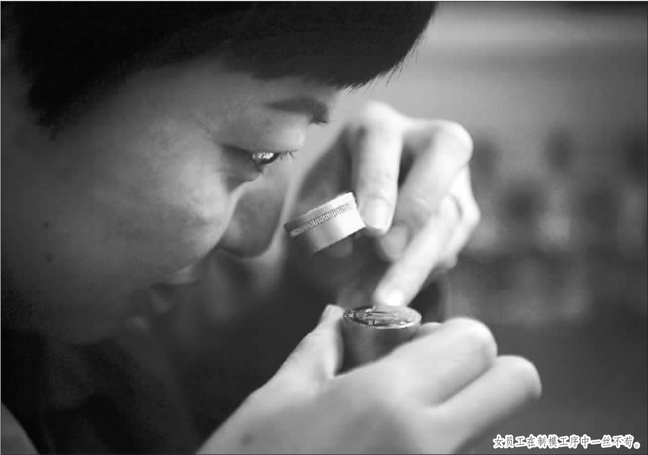
女工正在制模工序中一丝不苟。