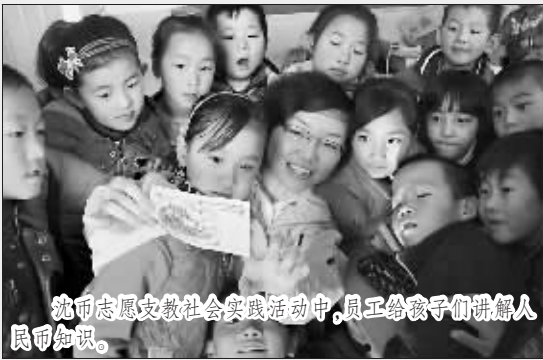
沈币志愿支教社会实践活动中,员工给孩子们讲解人民币知识。