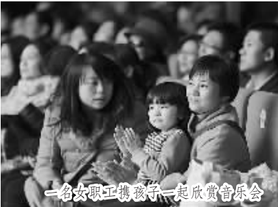
一名女职工被敬酒,一起欣赏音乐会

众所周知,新中国电影与旧中国电影的最大差别就在于,不同于只局限在上海、北京等少数大城市的极有限的电影生产、发行、消费的模式,新中国成立之后的几十年时间里,在全国自上而下建立了与省、市、县各级行政单位平行的电影发行公司,并几乎覆盖到全国各地的每一个角落。然而由于种种原因,在20世纪80年代中后期,中国电影的观影人数急速下降,到了1992年观影人次又下滑至105亿,呈现出断崖式下跌的趋势,原有