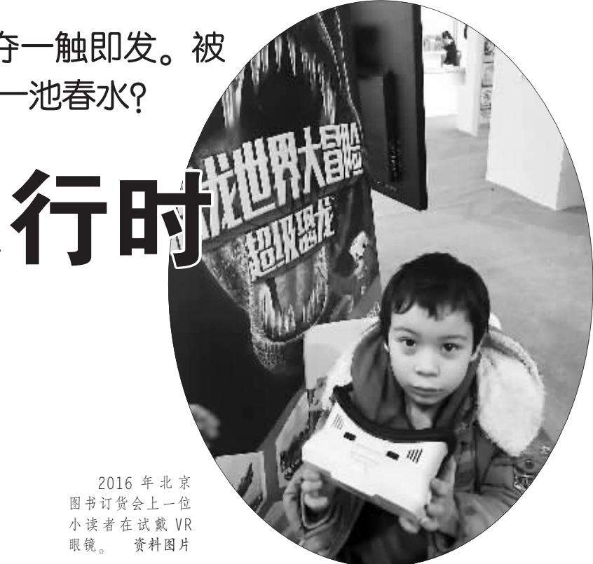
2016 年北京图书订货会上一位小读者在试戴 VR 眼镜。

据上海新闻出版局去年 11 月底发布的《2015 少儿出版阅读现状与未来趋势》显示,10 年间少儿图书市场一直在以年均 10% 的速度增长,已占据超过 40% 的图书份额。这一状况在北京图书订货会上也得到印证,参展的少儿出版社及少儿类出版物几乎占据半壁江山。如今,“VR+图书”的模式已经有不少