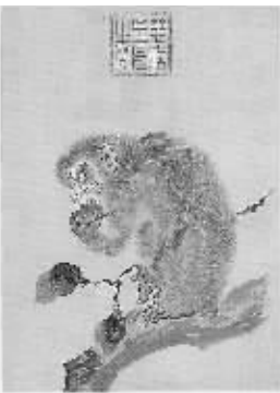
清 慈禧皇太后 猴图轴

孙悟空的本事无人不知:他可上天入地七十二变,有金刚不坏之躯、火眼金睛之力。他曾大闹地府与天宫,搅乱王母娘娘的蟠桃盛会,偷吃太上老君的金丹,十万天兵天将都打不过他,取经路上降妖除魔,护送唐僧取得真经修成正果,被封为斗战胜佛。