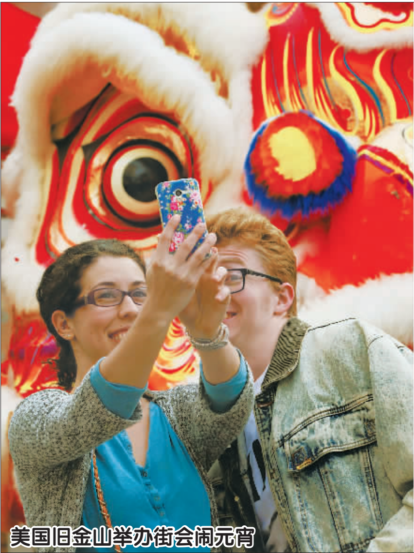
美国旧金山举办街会闹元宵

2月20日,在美国旧金山市唐人街,两名游客在元宵街会上自拍。当日,为期两天的美国旧金山市唐人街元宵街会开幕,吸引了大批市民、游客前来选购中国特色商品,感受中国春节民俗。这次元宵街会是由旧金山中华总商会主办的中国农历猴年新春系列庆祝活动之一。