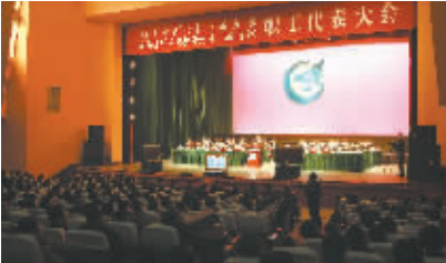
中航工业西飞第十一届九次、中航飞机西安飞机分公司第五届职工代表大会

西飞公司坚持每年召开两次职代会,对涉及职工切身利益的规章制度和重大事项按规定严格履行民主程序;制定了《西飞职代会