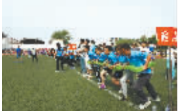
庆“七一”职工趣味运动会

代表意见答复落实工作流程》制度;开展了优秀职工代表评选活动;坚持每年开展民主评议领导干部制度,评议结果与领导干部任用挂钩;厂务公开做到制度健全,责任明确,内容全面、形式规范。