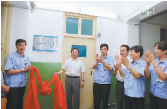
技能大师工作室揭牌