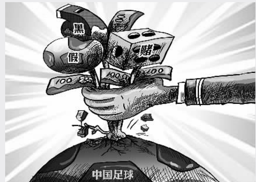
“假赌黑”的毒瘤一度让中国足球的职业化进程迷失了方向。

回顾中国足球 20 多年来的职业联赛,鲜亮的绿茵场上曾有过不少争议和质疑出现。“假赌黑”的毒瘤一度让中国足球的职业化进程迷失了方向,令中国足球人和喜爱足球的人们伤心不已。