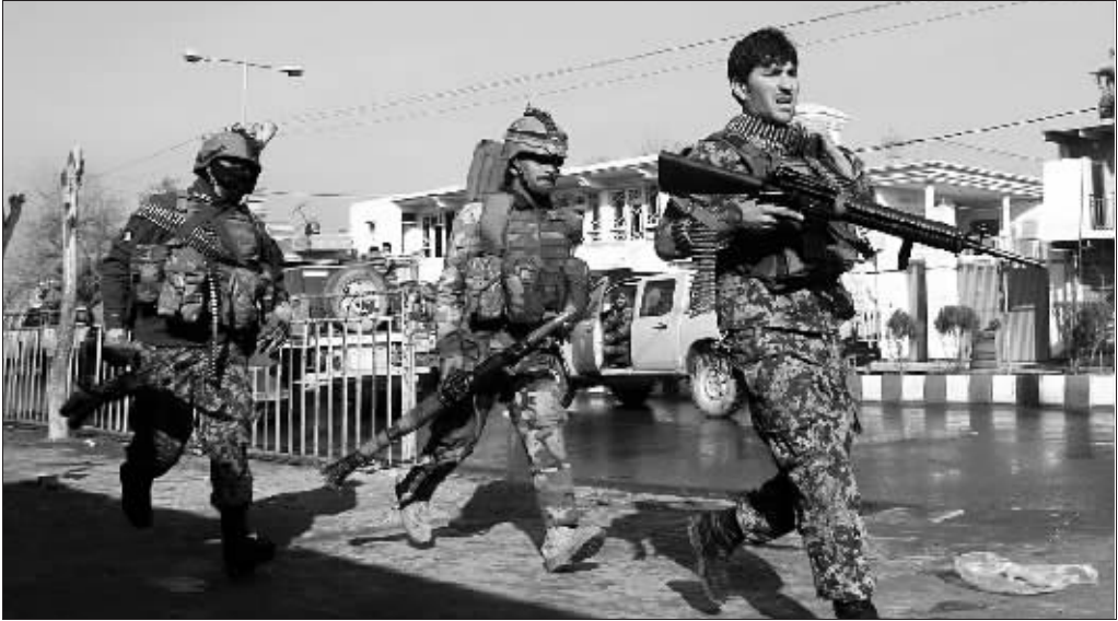
巴基斯坦驻阿富汗使馆附近发生爆炸

据报道,鲤鱼进食翻搅大量河泥,导致河水浑浊,鱼卵和水生植物缺氧而死;其携带的寄生虫传染给其他鱼类，致使默里-达令河流域近半鱼类濒临灭绝，严重破坏了那里的生态平衡。相关部门此前保护该流域生态环境的诸多努力收效甚微。