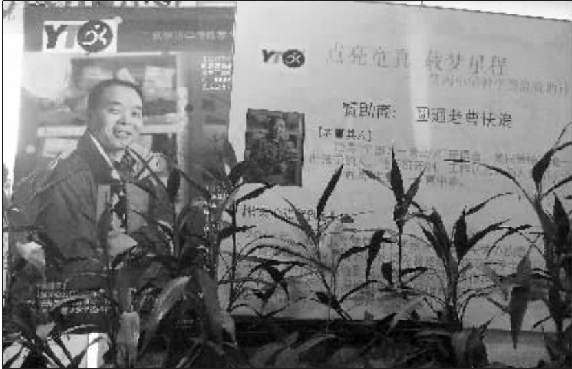
老曹工作室里张贴着老曹的事迹。

据介绍,该公司于2015年在达州市达川区总工会指导下,一改过去粗放式的协商“过场”,严格按照规范程序开展企业工资集体协商,协商中除对劳动报酬、工作时间、休息休假等方面与职工达成一致外,还首次把特殊工种的岗位补贴问题“摆在了台面上”。原来,