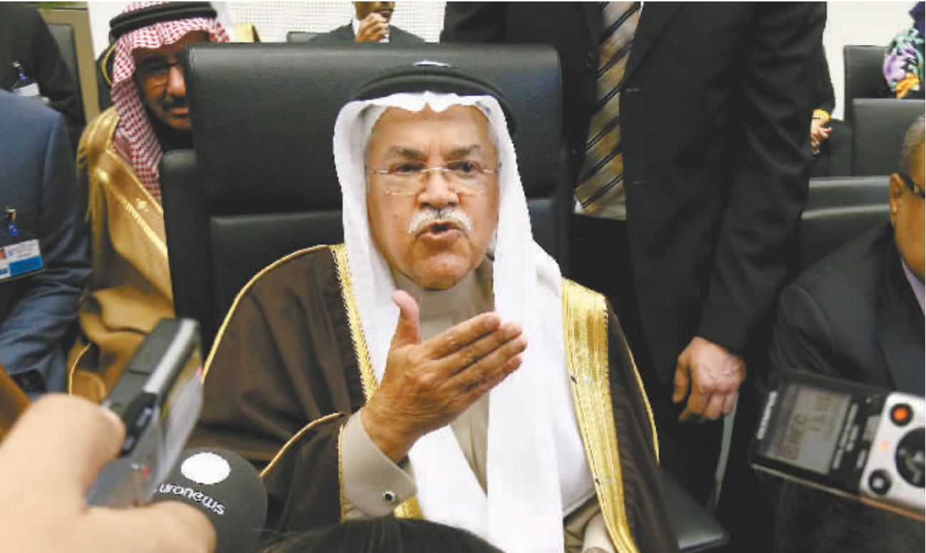
上月4日,奥地利维也纳,沙特石油和矿产资源大臣阿里·纳伊米在欧佩克开会前接受采访。