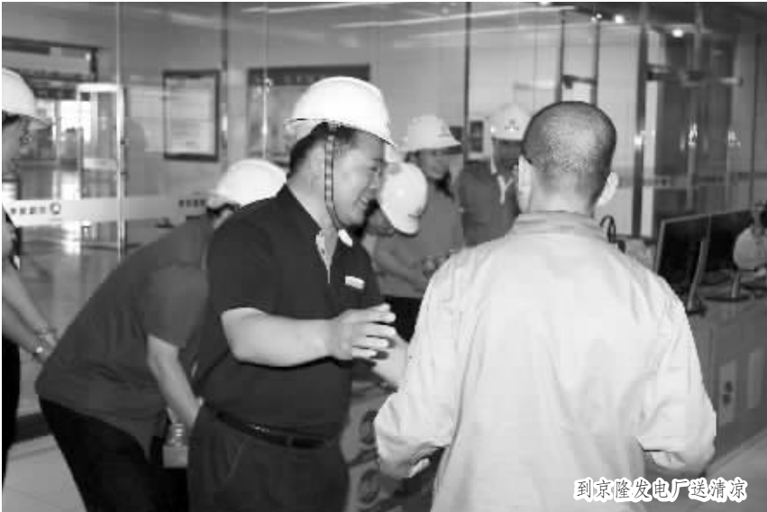
到京隆发电厂提清凉