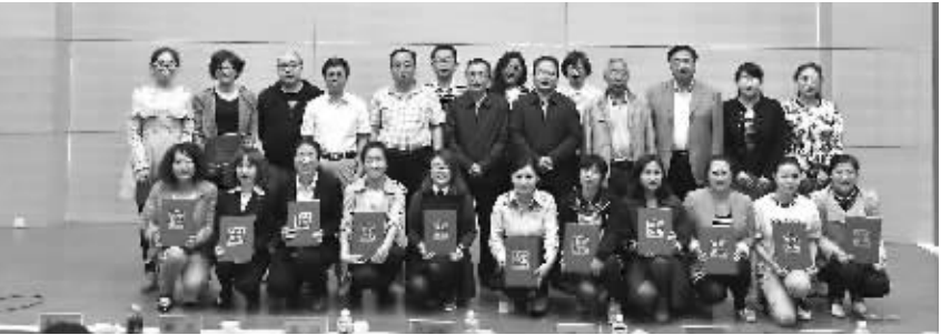
乌兰察布职业学院技能大赛

据统计,全市今年共举办工资集体协商培训班23期,受训人员1781人,基本做到了辖区内企业指导员培训全覆盖。全市各地已培育了23个工资集体协商典型,每个旗县市区都建立了两个典型。化德羊绒絮片行业、卓资熏鸡食品行业、集宁电子行业等成为全市工资集体协商的典型。