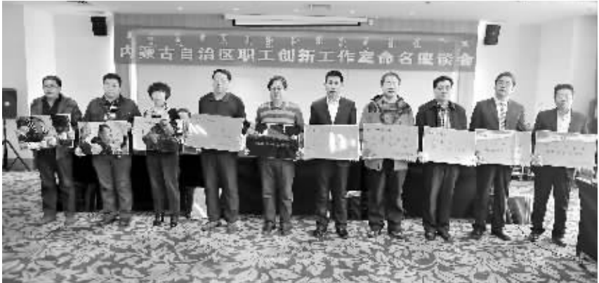
内蒙古自治区总工会命名内蒙古自治区级职工创新工作室

包头市总工会对于命名为市级的创新工作室统一给予2万元的工作经费奖励。全市各基层创建单位克服困难,积极推进,为职工创新工作室建设和运转创造良好条件,确保创建标准落到实处。同时,该市有条件的单位每年还为职工创新工作室投入专项资金,用于职工技术攻关研发活动。有的单位还给予工作室创建人员每月一定的津贴。