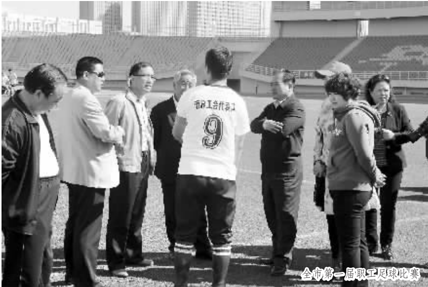
全市第一届职工足球比赛

按照“三有”(有会议记录、有征集议题、有履行结果)规范化目标,全市建立职代会制度的单位1402个,基层工会建立职代会制度的单位2002个,建立厂务公开制度的单位3009个,建立职工董事会的单位198个。