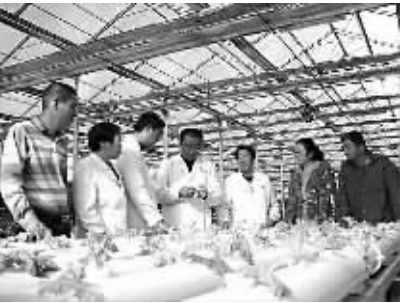
呼伦贝尔市海拉尔区绿康合作社职工创新工作室