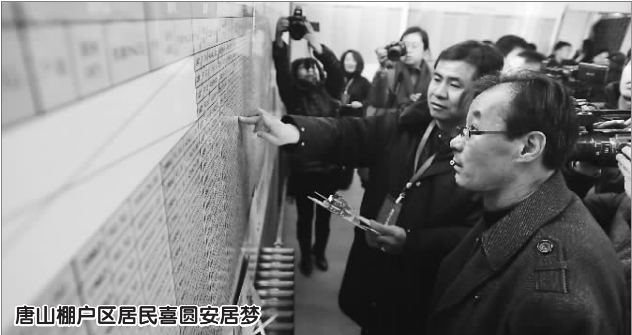
唐山棚户区居民喜圆安居梦

另外一家借贷平台的数据更能说明问题,该平台可为本科生提供1万元贷款,每笔贷款到账之后要收取10%的“指标”费用,此外,真正到账的并非全额,而是只有8000元,差出的2000元由公司暂时扣留,等还清贷款