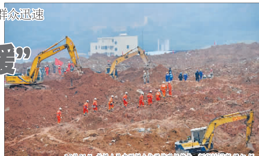
12月21日,救援人员在深圳山体滑坡现场搜救。

来自陕西的小李是深圳惠科公司的员工,事发时急着逃命,只披了件外套,穿着拖鞋就跑了出来,身份证、钱等都没有带。(下转第3版)