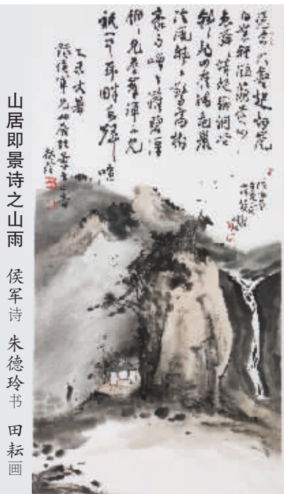
山居即景诗之山雨