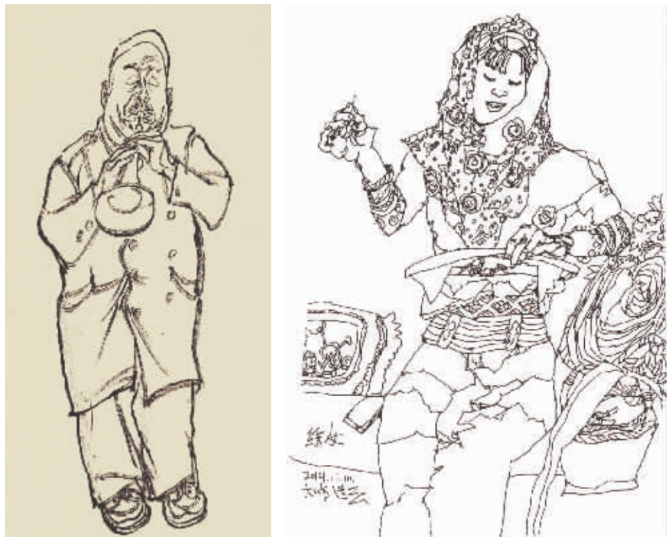
陕西老腔系列之六