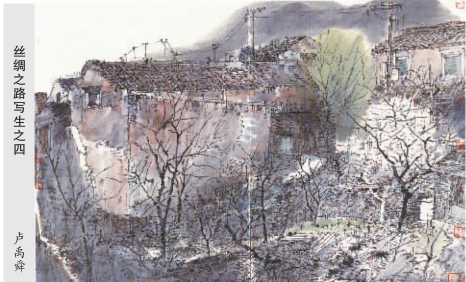
丝绸之路写生之四