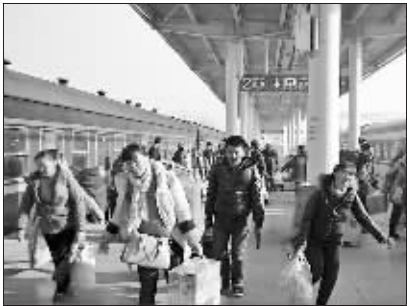
新疆铁路：今冬农民工返程运输结束