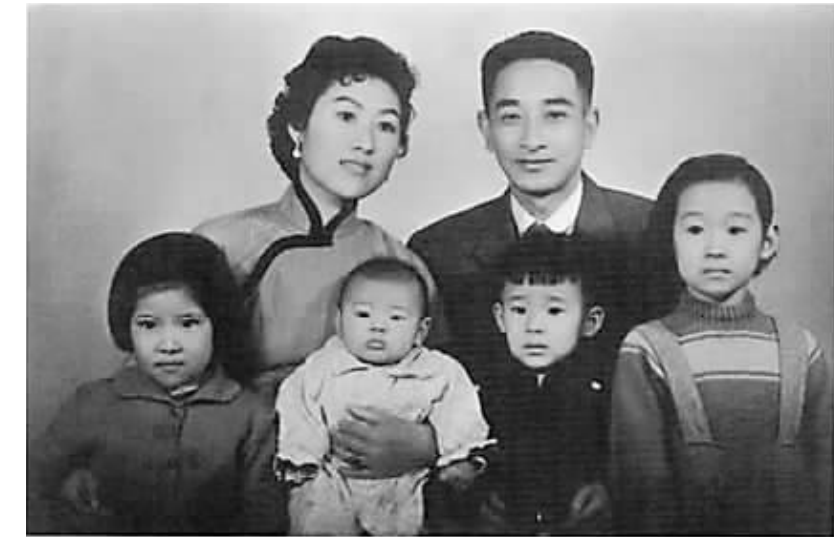
后排:南怀瑾(右)南怀瑾夫人(左) 前排:南圣茵(左一)南国熙(左二)南可孟(右一)南一鹏(右二)

南怀瑾一直试图还原孔子思想家的地位,让大家看到儒家思想是正向的。他说,那些强调纲常伦理一类的东西,是后代儒生为了适应国家统治的发展而逐渐附加上的。于