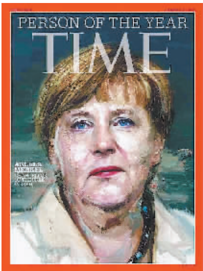
德国总理默克尔当选 2015 年《时代》周刊年度风云人物。

全球化增强了世界各国的相互依赖,对这种依赖关系中主动权的争夺导致了目前中东的混战。欧洲作为争夺的一方,不可能就此全身而退。据欧盟估计,这场难民潮将持续到 2017 年,届时将有约 300 万难民迁