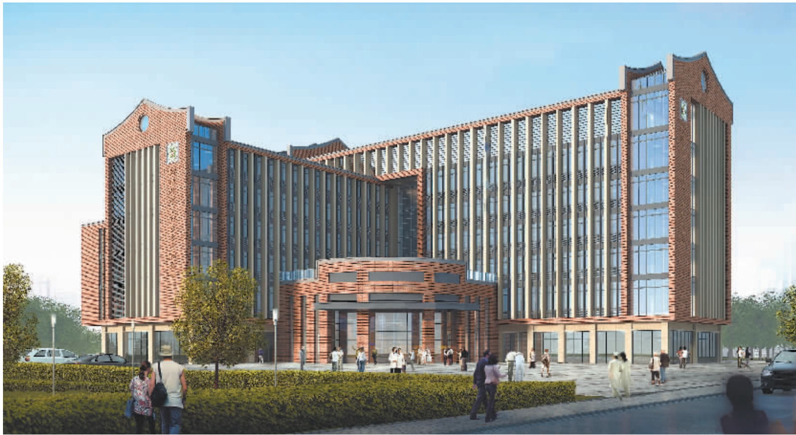
晋江经济开 发区职工活动 中心主体大楼

据了解，建成后的体育公园和职工 活动中心占地将近70亩，这在乡 镇级的工人文化阵地中实 属少有。