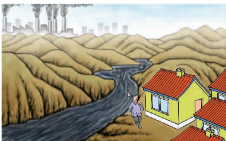
上游发展下游遭殃