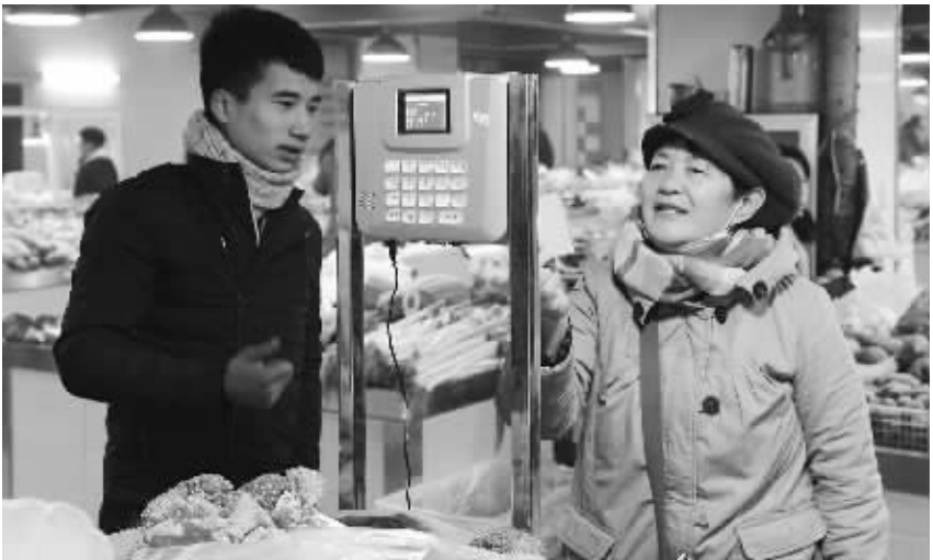
郑州首家星级智慧农贸市场开业

《规定》强调,对违反本规定禁止行为的领导人员,视情节轻重,分别给予警示谈话、调离岗位、降职、免职处理,或给予相应的党纪政纪处分,同时减发或全部扣发年度绩效薪金,涉嫌违法犯罪的,依法移送司法机关处理。