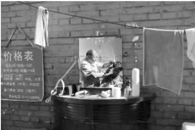
位于北京三环边上的明光村,一名街头理发师在给顾客理发。他说:“由于城市规划需要,类似这样的街头理发将会越来越少。”

传统物流行业“小、散、乱”的现状急剧向信息化、智慧化靠拢,物流市场大踏步与“互联网+”融合