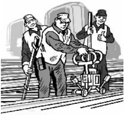
名师带徒 奖励练功 法明/画

物质需求的满足是必要的，没有它会导致不满，但是即使获得满足，物质激励的作用往往是有限的、不能持久。