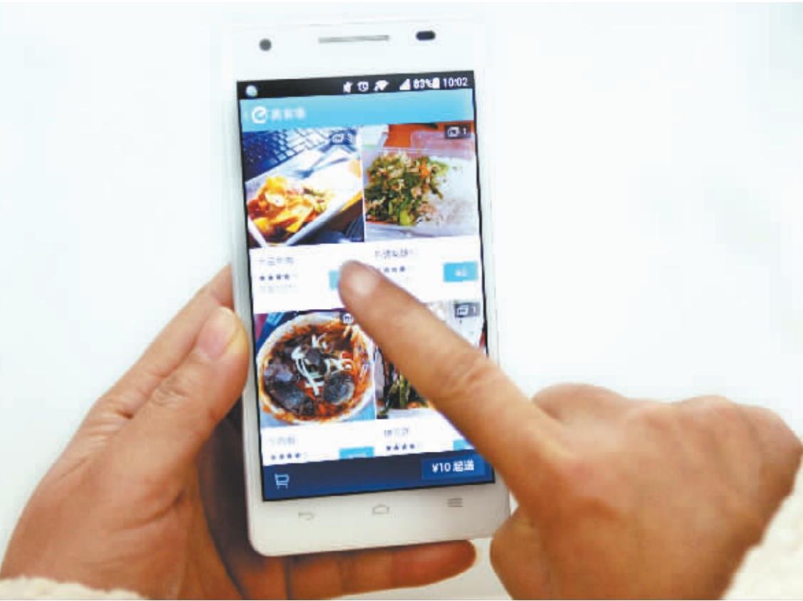
湖北省武汉市,湖北经济学院一学生通过手机APP网上订餐。

由中国中铁大桥局承担建设的九洲航道桥段(CB05标段),是三个海上桥梁标段中工程量最大、结构形式最复杂的标段。CB05标全长6.653公里,主要包括九洲航道桥、珠海口岸人工岛连接桥、互通立交等工程。大桥施工区域海况恶劣,地质结构复杂。此外,还